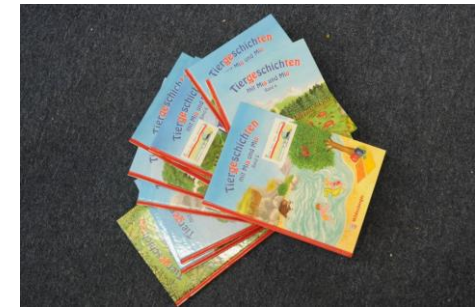
Lesebücher mit der neuen Silbermethode