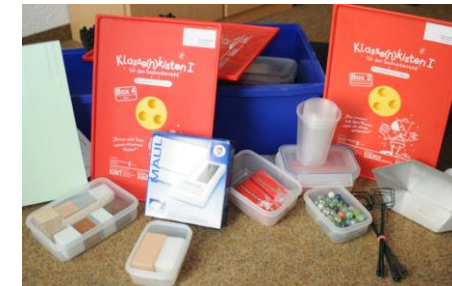
Experimentierkästen für den Sachunterricht