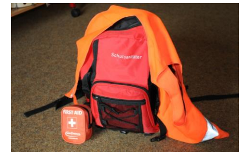
Ausrüstung für Schulsanitäter